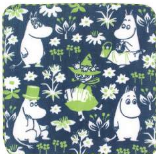
06006 ムーミンフレンズ 紺