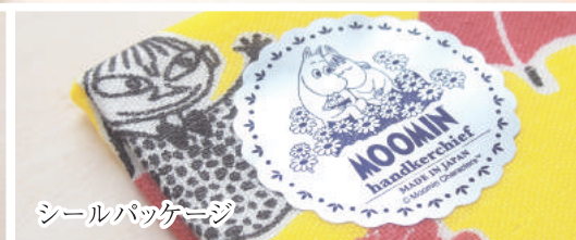
シールパッケージ