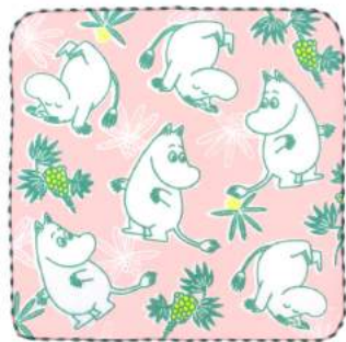
06002 ムーミン&グレープ