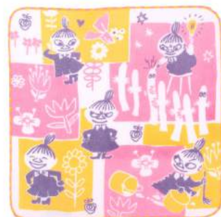
06009 リトルマイ&ニョロニョロ