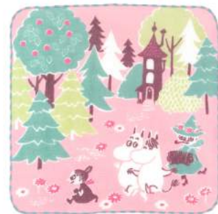
06005 ムーミンフレンズ ピンク