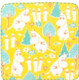
06008 ムーミン&ニョロニョロ