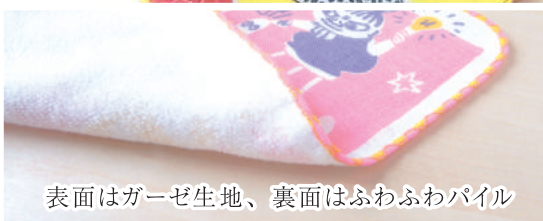
表面はガーゼ生地、裏面はふわふわパイル

MOOMIN handkerchief ムーミンのハンカチーフができました 表面はガーゼ生地、裏面はふわふわパイルの ハンカチーフです